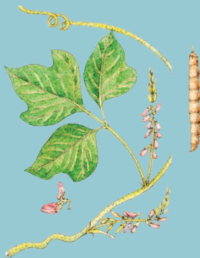
Kudzu (lat. Pueraria lobata )